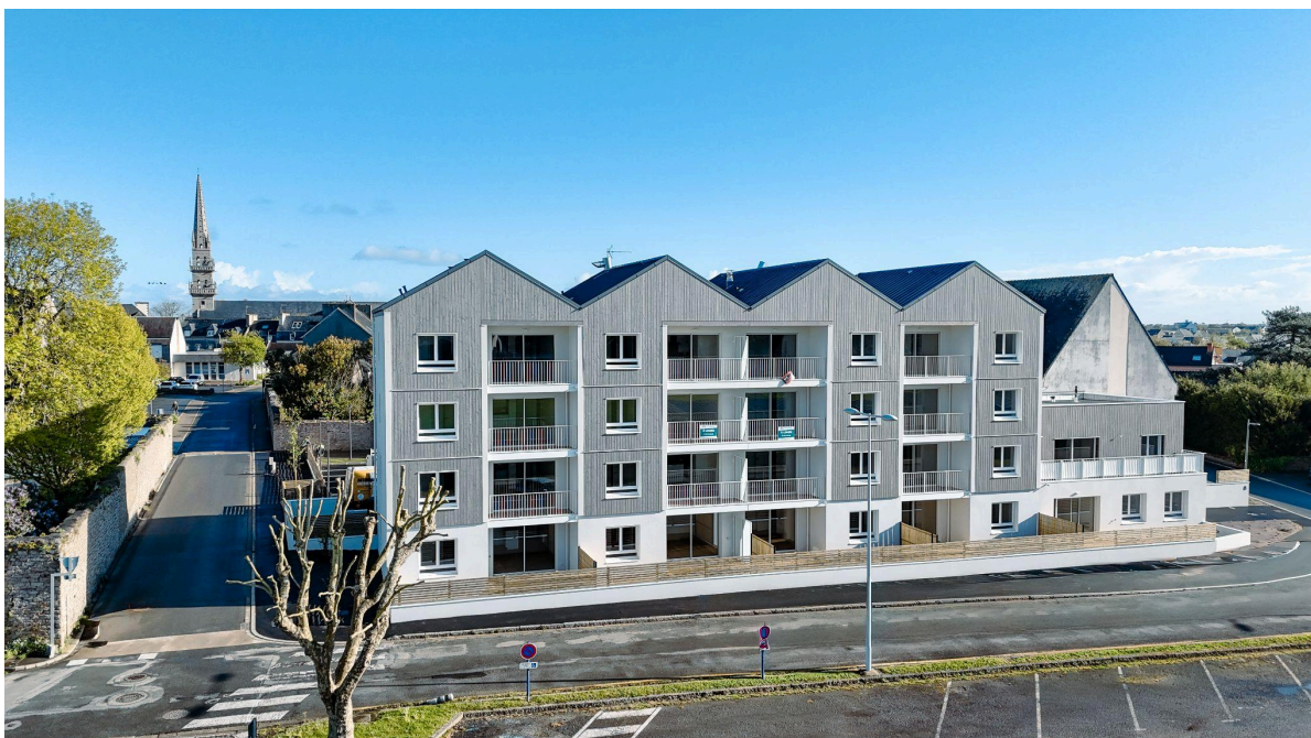
[Amenatys] Programme immobilier OYAT à Ploudalmézeau (29)